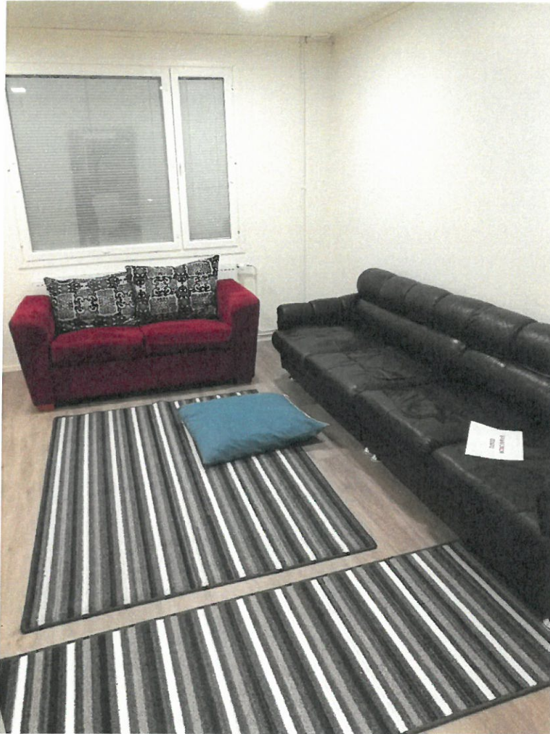
Kuva 9 Muoniolaiset lahjoittivat Kyläpirttiin mm. sohvut, mattoja ja istumatyynyjä.