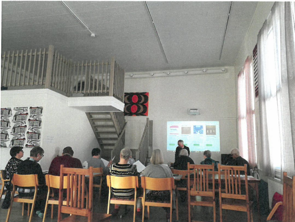
Kuva 7 Käsivarren senioreiden järjestämä Digikurssi. Kurssi saa jatkoa syksyllä 2019.

Teknologiakeilut jäivät hankeaikana hieman pienemmälle huomiolle. Hyvin pian pilotointien alettua huomasimme, että teknologiavälitteisten palveluiden ja kokeilujen järjestäminen vaatisi paljon enemmän aikaa ja resursseja, kuin mihin olimme varautuneet. Tilaan on kuitenkin hankittu kannettava tietokone, tykki, dokumenttikamera, web-kamera ja hyvä äänentoistolaitteisto. Investointihankkeen puolella tehtiin tablettitietokonehankinnat, jotka saapuivat Kyläpirtille kesäkuussa. Tablettitietokoneet otetaan käyttöön varsinkin ikäihmisten toimintatuokioissa heti syyskauden alettua.