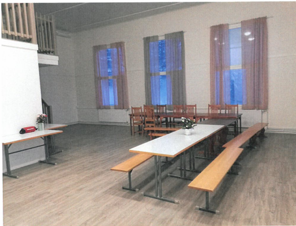
Kuva 10 Väliaikaiseen käyttöön sopivia tuoleja ja pöytiä saatiin lahjoituksena sekä lainaksi.