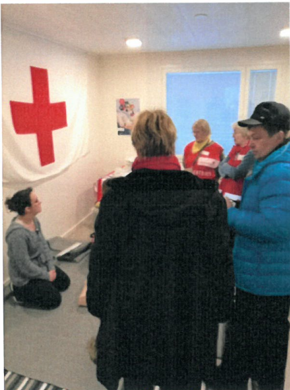
Kuva 3 SPR:n piste keräsi paljon väkeä ja ensiaputaitoja harjoiteltiin yhteistuumin.