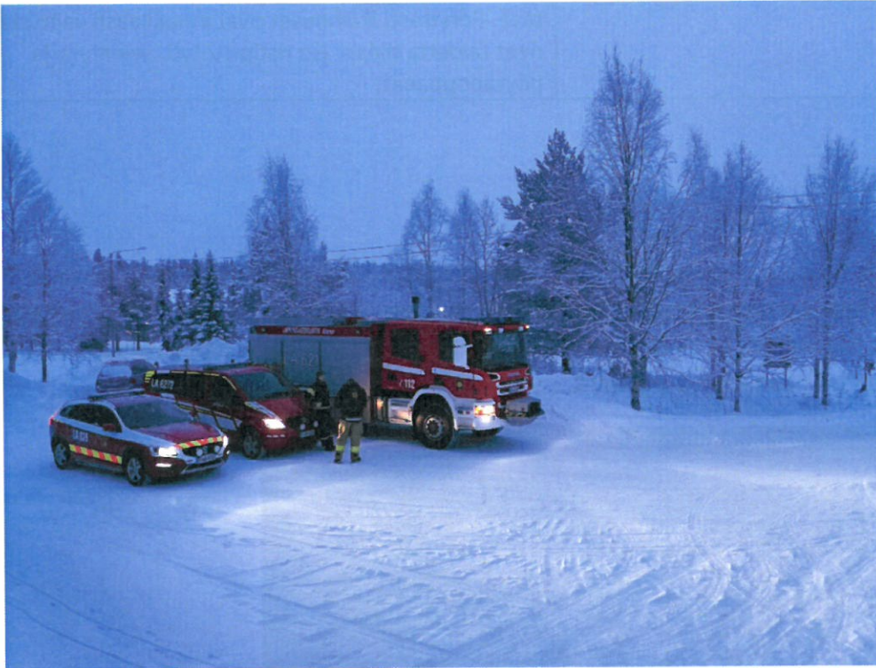
Kuva 2 Pelastuslaitos ja VPK valmiina kaluston esittelyä varten.