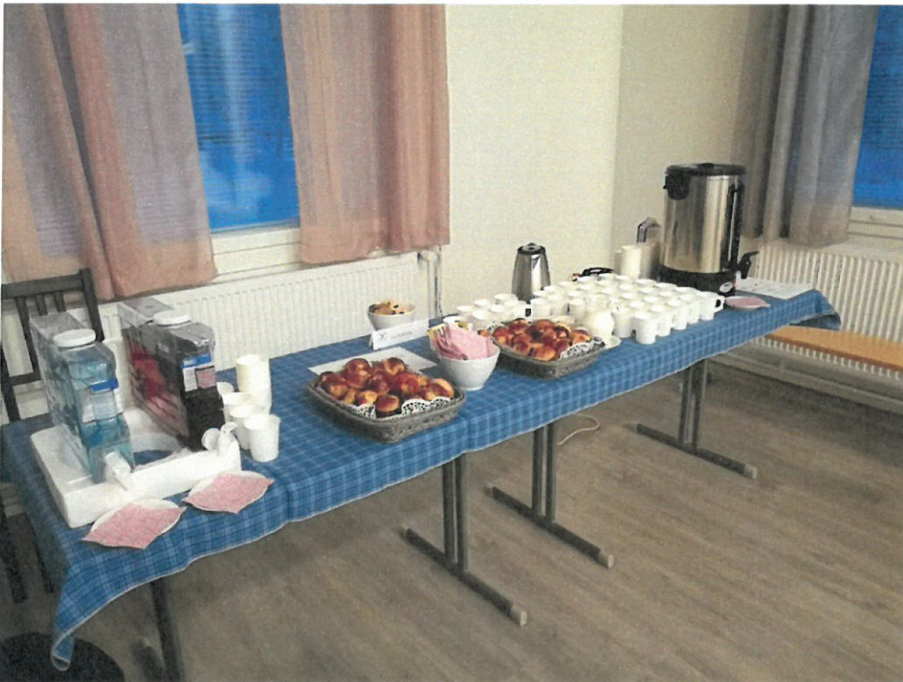
Kuva 1 Martat huolehtivat tapahtuman tarjoiluista. Pullat ja mettäkakot oli valmistettu vapaaehtoisvoimin.

Avajaisten valmisteluihin ja toteutukseen osallistui useita eri yhdistyksiä ja vapaaehtoistoimijoita. Mukana järjestelyissä olivat Vapepa, Pelastuslaitos, VPK, SPR, Tunturi-Lapin Allergia- ja astmayhdistys, Jieris ry, kansalaisopisto ja Muonion Martat. Vierailijoita oli lähemmäs 200. Vieraiden joukossa oli myös kunnanjohtaja, valtuuston puheenjohtaja sekä muita virkamiehiä ja päättäjiä.