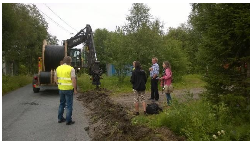
Kuva 6, Alma Media tekemässä juttua Kaakamon kuituverkosta

Tiedotusvälineet olivat mukana Kaakamon kuituhankkeessa, olimme useita kertoja esillä niin Radio Perämeressä kuin paikallisissa lehdissäkin.