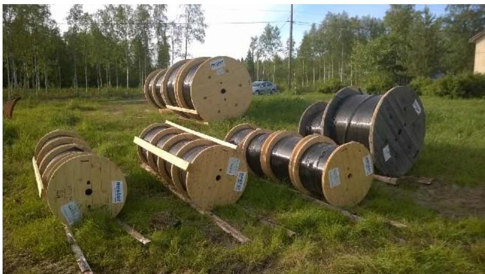
Kuva 2, Kaapelikelat

Nestor Cablesin kuidut verkkohankkeeseen toimitti SLO-Kemi