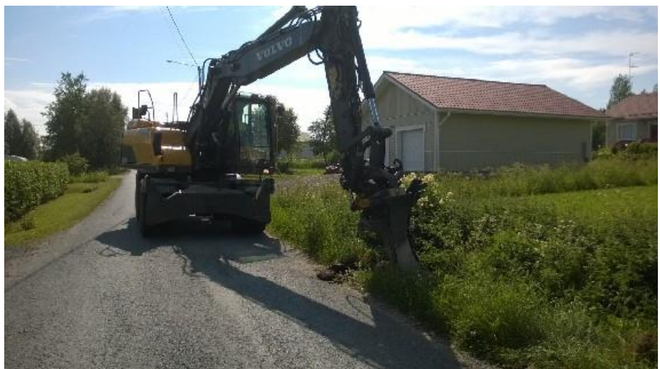
Kuva 4, Esiaurausta Alapääntiellä

Työt alkoivat esiaurauksilla Laivaniementien reunassa, ja kohta heinäkuulle taittuessa olivat kuidut mukana auran matkassa kun Kylätalolta koneet kulkivat koulun suuntaan.