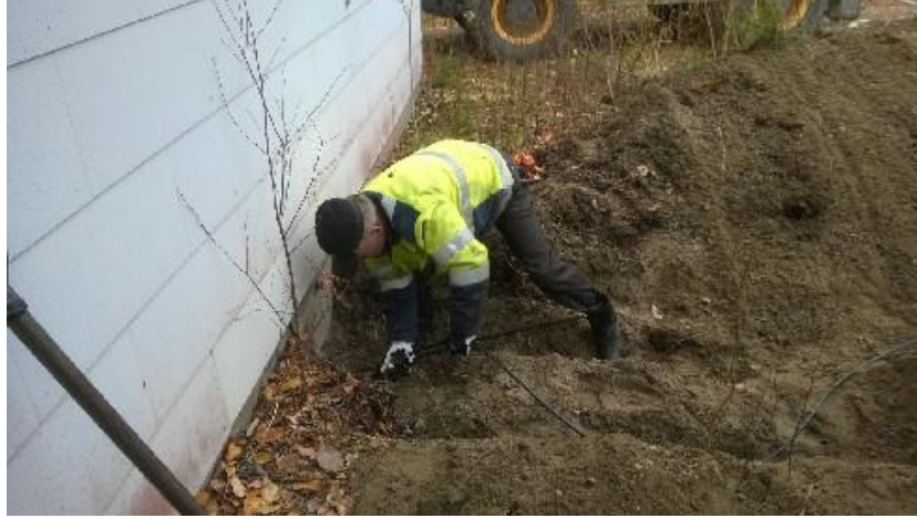
Kuva 7, Operaattorikuidun syöttö asennusputkeen

Elokuun lopun koittaessa oli urakka viimeistelyjä vaille valmis, maakaivoja ei kuitenkaan voinut vielä peittää, koska kuitujen hitsaus oli vielä kesken. Kuituliittyjien lisäksi tarvittiin kuituyhteys myös operaattorille, erillinen yhteyskuitu aurattiin Soneran teletilaan Laivaniementielle.