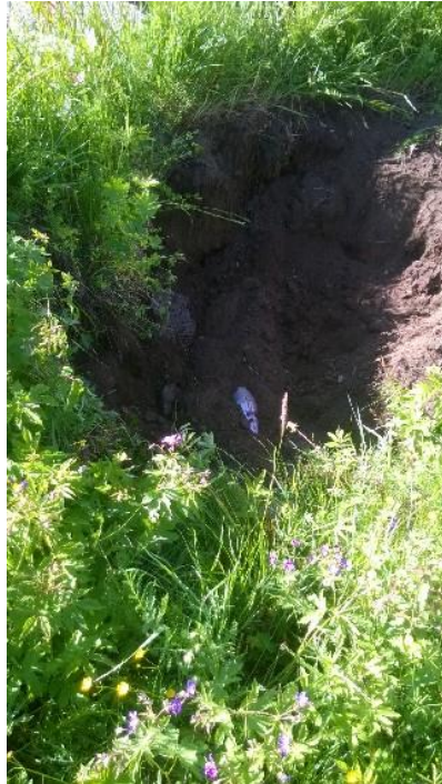
Kuva 5, Alituspora on läpi

Heinäkuun lopulla lämpimässä kesäpäivässä ei voinutkaan enää asfalttia pitkin aurata päivisin, joten koneet etenevät päivisin hiekkateitä ja iltaisin päällystettä pitkin. Teiden alituksia tehtiin useita.