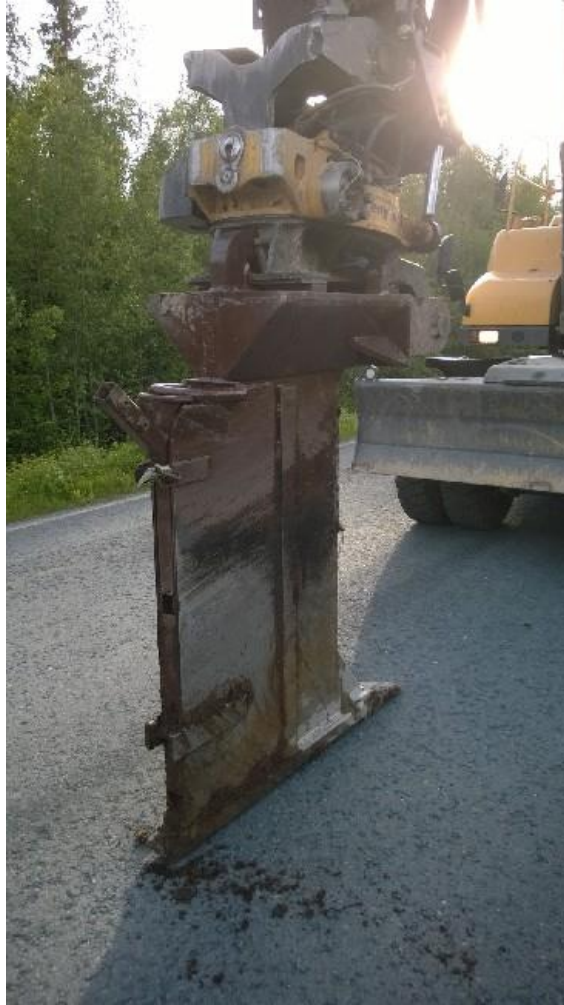
Kuva 3, Aura valmiina

Työt alkoivat esiaurauksilla Laivaniementien reunassa, ja kohta heinäkuulle taittuessa olivat kuidut mukana auran matkassa kun Kylätalolta koneet kulkivat koulun suuntaan.