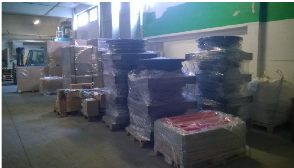
Kuva 1, Kuitumateriaaleja varastolla

Nestor Cablesin kuidut verkkohankkeeseen toimitti SLO-Kemi